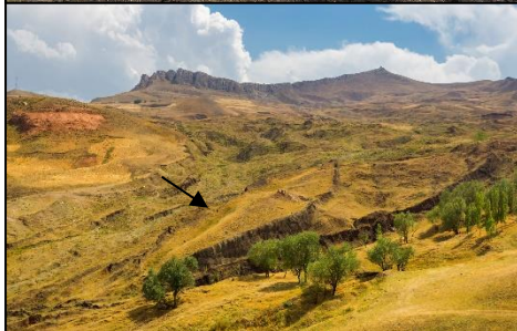
Ubos nga duha nga mga imahe - Gibanabana nga lokasyon sa Arka ni Noe sa Sidlakang Turkey, Lalawigan sa Agri. Ang Arka ni Noah National Park.