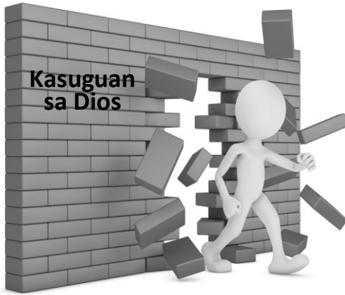
Ang sala mao ang paglapas sa Kasuguan

“Ang dautan magapatay sa dautan” (Salmo 34:21)