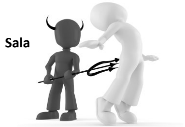
Ang sala (dili ang Diyos) maoy nagdalag kamatayon

“Ang dautan magapatay sa dautan” (Salmo 34:21)