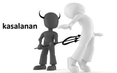
Ang kasalanan (hindi ang Diyos) ang nagdudulot ng kamatayan

“Papatayin ng kasamaan ang masama” (Awit 34:21)