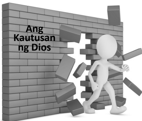
Ang kasalanan ay ang paglabag sa Kautusan

Totoo na ang kasalanan ay nakakasakit sa Diyos, ngunit dahil lamang sa nakakapinsala ito sa makasalanang mahal Niya.